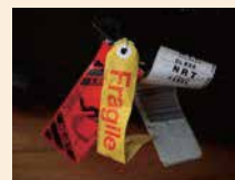
Этикетки для розничной торговли