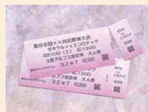
Печать билетов и ярлыков